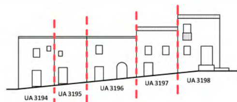
Via San Tussio