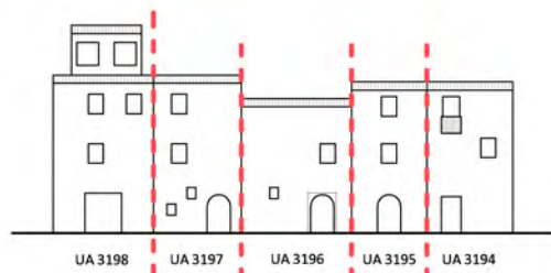
Via dei Giardini