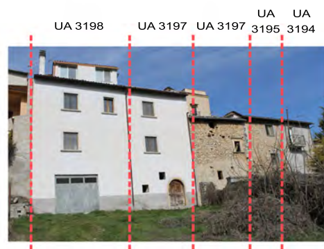
Via dei Giardini